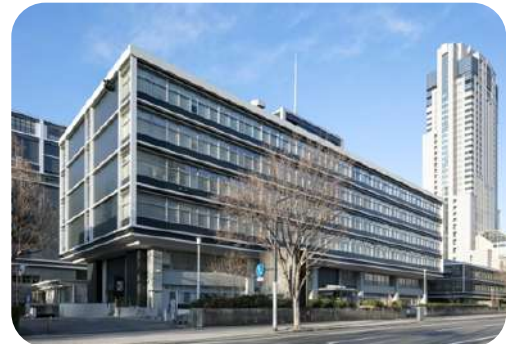
広島県庁舎北館内外部改修その他工事