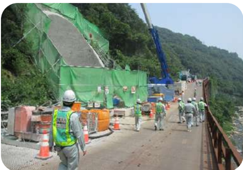
主要地方道呉平谷線道路改良工事（R5-2工区）（その2）