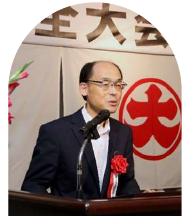
呉労働基準監督署長祝辞