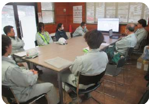
(株)ダイクレ安芸津工場 新築工事