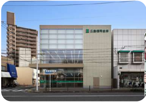
広島信用金庫 己斐支店新築工事