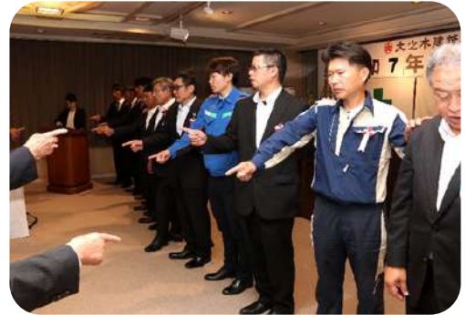
“ゼロ災で行こうヨシ!” 唱和