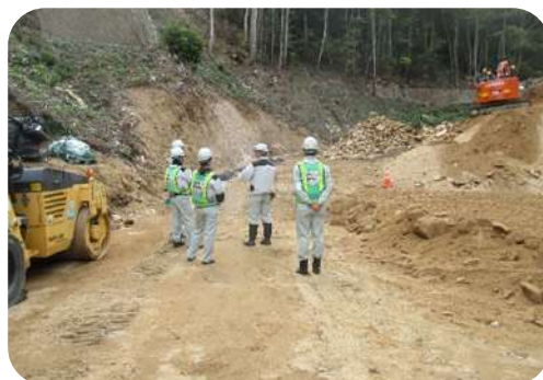
令和6年度広島西部山系倉重2号砂防堰堤外工事