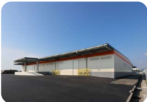
広島港廿日市木材製品8号上屋新築工事