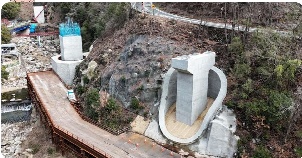
主要地方道 呉平谷線 道路改良工事 (R5-2工区) その2