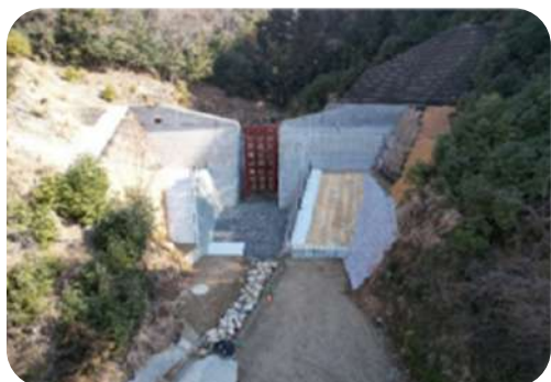
令和5年度広島西部山系矢口川支川溪流遊砂地外工事