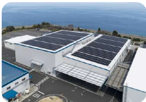
デルタ工業(株)由宇工場第3プレス工場棟新築その他工事