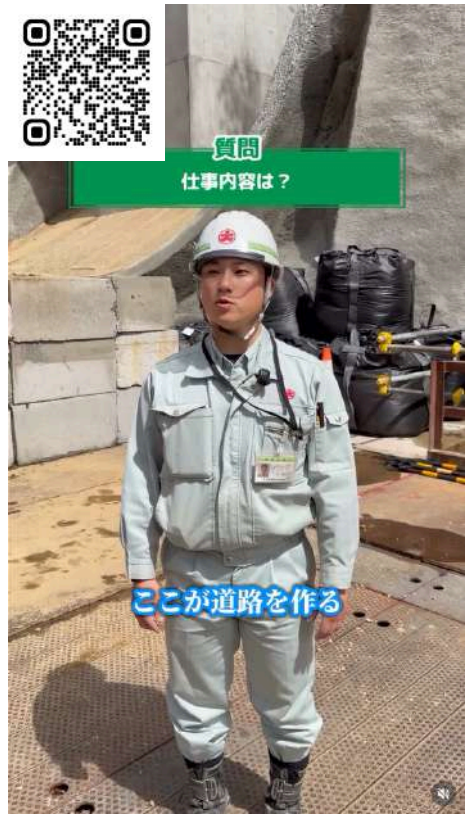
インタビュー動画