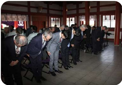
安全祈願祭 (亀山神社)