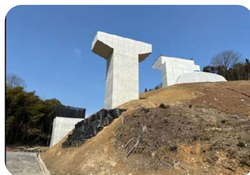
令和6年度福山道路長和E-1ランプ橋第1下部工事