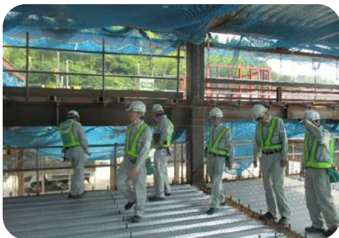
令和6年度地域活動拠点整備事業ほか高屋西地域センター ・高屋中央保育所複合施設新築工事（建築）JV70%