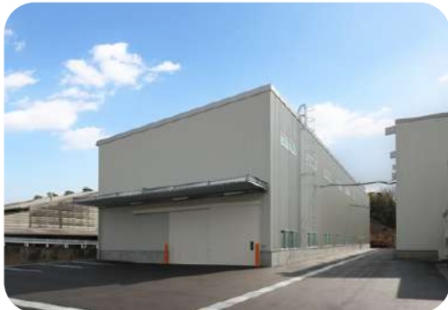
大石ステンレス産業(株)東広島コイルセンター新工場増築工事