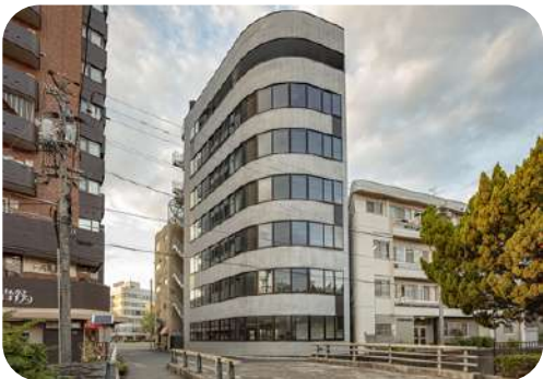
(仮称) 大矢整形外科病院新築工事