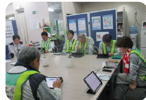
二級河川堺川水系内神川河川改修工事（6工区）（その2）