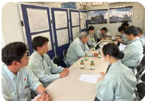
(株)こっこー東広島リサイクルセンター建替工事