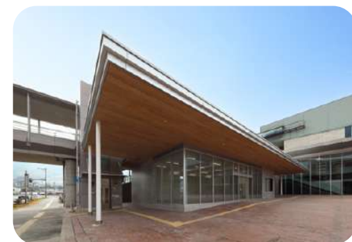
呉市海事歴史科学館ミュージアムショップ棟建設工事