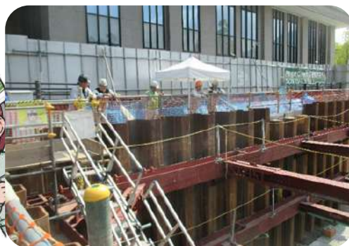
二級河川堺川水系内神川河川改修工事（6工区）（その2）