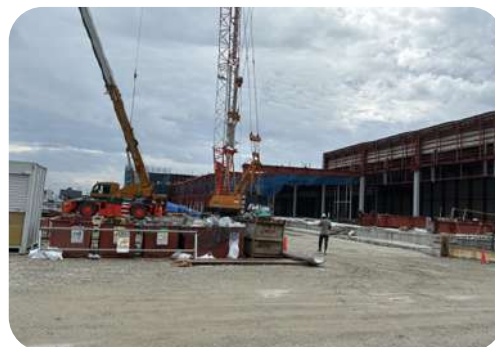
株式会社ムロコ下関営業所冷蔵冷凍倉庫新築工事