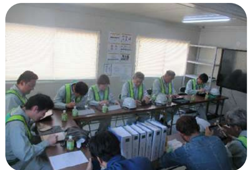
(株)こっこー東広島リサイクルセンター建替工事