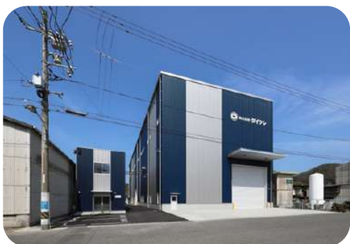
(株)ダイクレ安芸津工場 新築工事