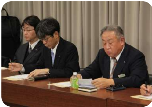
総括安全衛生管理者挨拶