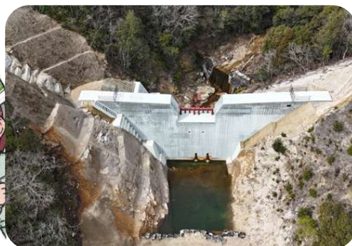
令和6年度安芸南部山系大屋大川溪流上流支川砂防堰堤第2工事