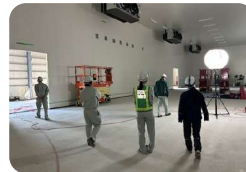
中通冷蔵(株)冷凍倉庫新築工事