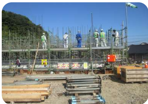
令和5年度岩国・大竹道路小方高架橋下部外工事